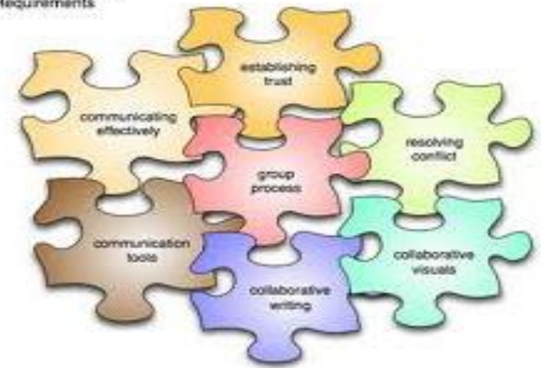
Online Group Work Requirements